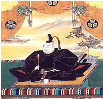
徳川家康像 (狩野探幽画 大阪城天守閣蔵)

三河国の小領主から、織豊政権の大大名へ、そして天下統一を継承して江戸幕府を開き、太平の世を築いた徳川家康について、家臣やさまざまな分野の側近など政権を支えた者達の文書や自筆書状から歴史的な事績を追ひ、大名そして天下人としての家康の実像に迫ります。